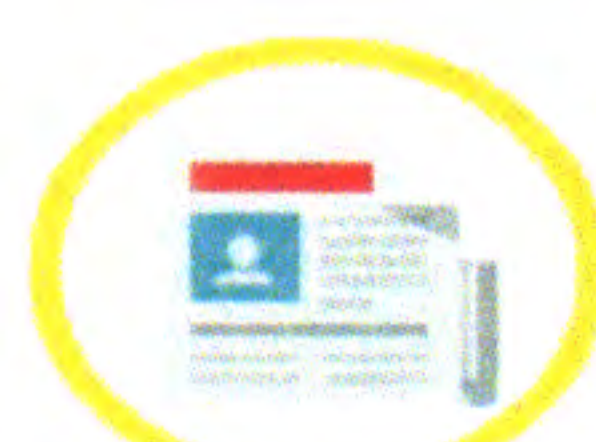
NOVINY 3 - 12 MEŠIACOV