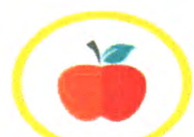
OHRYZOK JABLKA NIEKOĽKO TYŽDŇOV