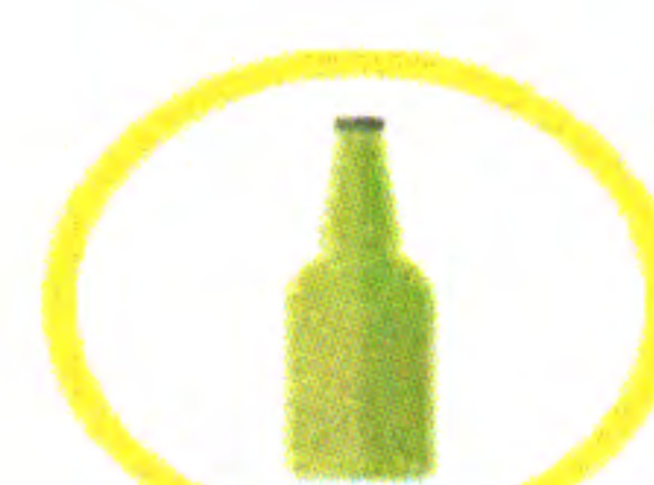
SKLO 4000 ROKOV