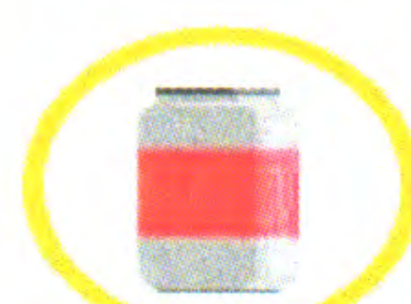
PLECHOVKA 20 - 100 ROKOV