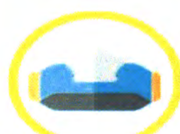
PAPIEROVÁ VRECKOVKA 3 MEŠIACE