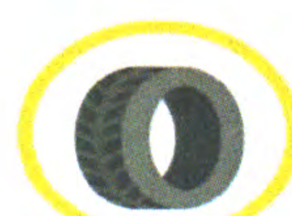
PNEUMATIKA 200 - 300 ROKOV